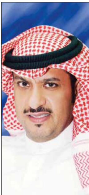
• طلال الخالد الصباح

ترعى مؤسسة البترول الكويتية فعاليات مؤتمر الكويت للمسؤولية الاجتماعية للشركات والمؤسسات الذي تنظمه شركة سباسبال للمؤتمرات والمعارض يومي 28 و29 سبتمبر 2011 والمقام في فندق كراون بلازا. وبهذه المناسبة قال العضو المنتدب للعلاقات الحكومية والإعلام الشيخ طلال الخالد الصباح «تتبع رعاية مؤسسة البترول الكويتية لهذا الحدث المهم من إيمانها بأهمية المسؤولية الاجتماعية للشركات ومؤسسات المجتمع المدني، خصوصاً أن المؤسسة أدركت منذ تأسيسها أن مفهوم المسؤولية الاجتماعية أعمق وأوسع من أن يتم التبرع