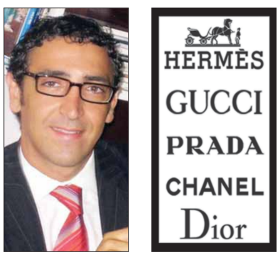
• ماركات عالمية