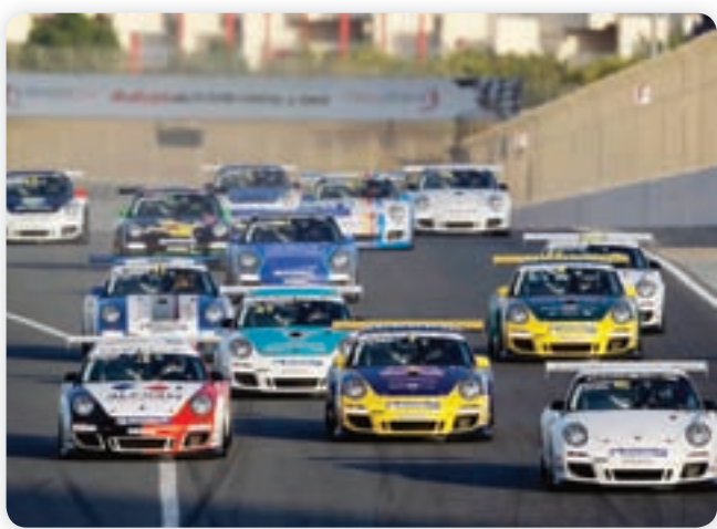
• معركة المناضلة بدأت مع اللغة الأولى