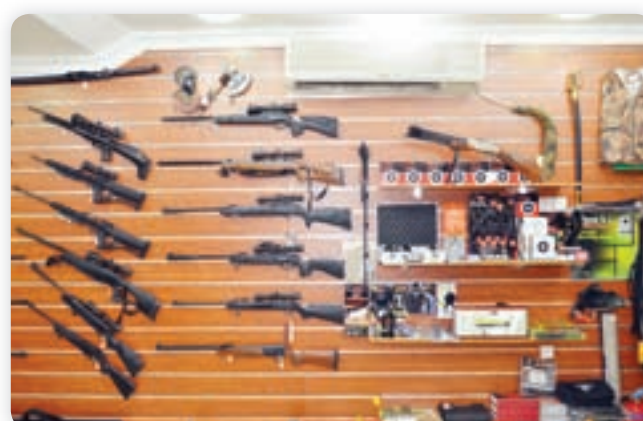
• من أسلحة الصيد التي يوفرها المتجر لعملائه

والاكسسوارات ومنها المنظار (الدربيل)، أحزمة البنادق، حقائب البنادق، اجهزة قياس سرعة الصمك، منظار قياس المسافة، أقلام تعبئة الصمك، قواعد التثبيت وغيرها. هذا ويعتبر الصيد بالبنادق الهوائية احدى الرياضات التي يعيشها أهل الكويت، لما تشكل من أهمية بالغة على الصحة العقلية والجسمانية، والقدرة على تنبيه أعضاء البدن وتوطد قدرة الاعتماد على النفس، وتقوية الإرادة وتورث الشجاعة، وهي تتطلب توافقاً