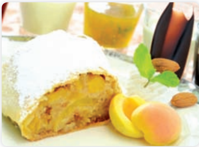
• اذ أنواع «الستروبل» بالمقهى الإنجليزي

تتفرد مطاعم فندق شيراتون الكويت خلال شهر نوفمبر بمجموعة من الأطباق الموسمية التي طالما اعتاد عليها الزوار والراغبون في الاستمتاع بتجربة طعام فريدة غنية بما لذ وطاب بمأكولات من مختلف أنحاء العالم.