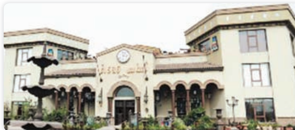
• مقر الشركة في المنطقة التجارية الحرة